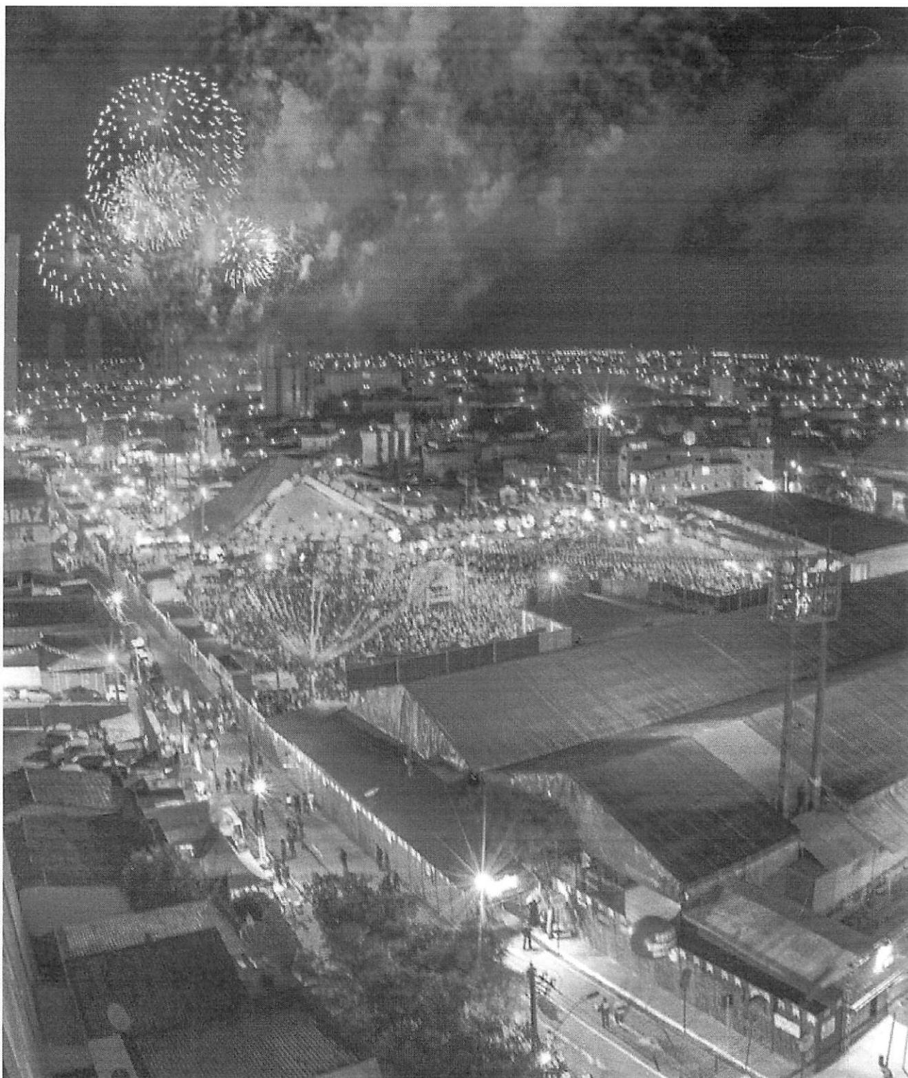
São João de Campina Grande: Como a festa junina ‘pulou a fogueira’ da crise

Assim como ocorre em vários segmentos da economia, as festas populares bancadas por recursos do contribuinte passam a enfrentar a maior crise da história. A grande maioria dos municípios, que há várias décadas vinha investindo pesado na contratação de estruturas e cachês milionários dos artistas em evidência, já passa a repensar os custos, diante da inescapável